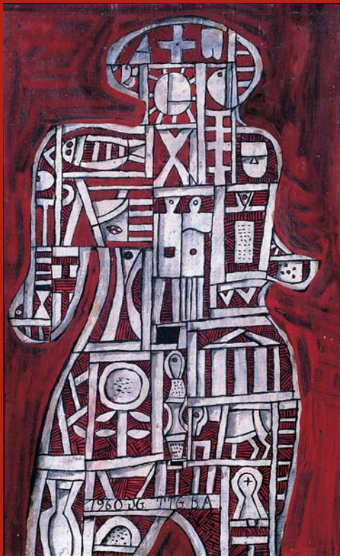
"Hombre constituido en Rojo" - José Gurvich

en la década del hueso y de las articulaciones 2000 — 2010